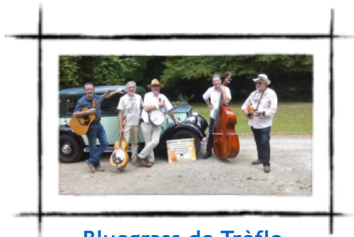
Bluegrass de Trèfle

21h30 : Saga Trio - des racines de la musique traditionnelle aux musiques actuelles